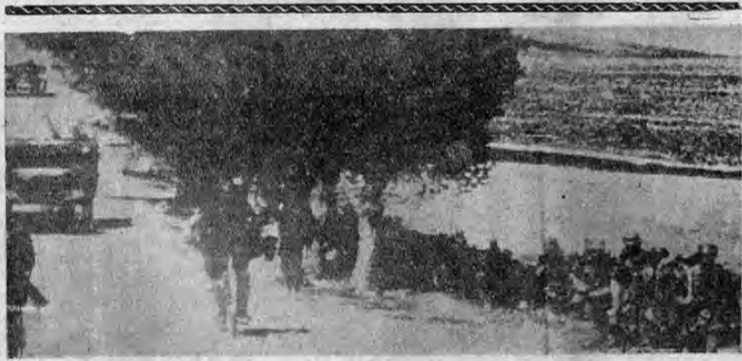
AVANCE rápido.—Radiada de Berlín a Nueva York el día 28 (sábado pasado) he aquí una foto que destaca un aspecto del avance alemán a través de Rusia. Los informes cablegráficos de ese día señalaron una rapidez extraordinaria al avance alemán.

Será un acto sencillo de cordialidad y fuera del ritual protocolario