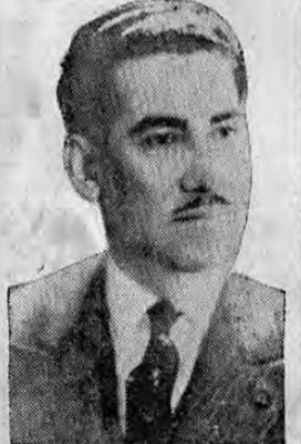
Dr. Don ARNULFO ARIAS, Presidente de la República de Panamá que a medio día de hoy llegará a San José, como distinguido y apreciable huésped del pueblo y gobierno de Costa Rica

La opinión pública chiricana (PASA a la Pág. 5, Col. 1)